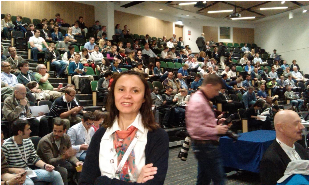
EURO 2015 Opening Session, Sunday July 12, 2015.