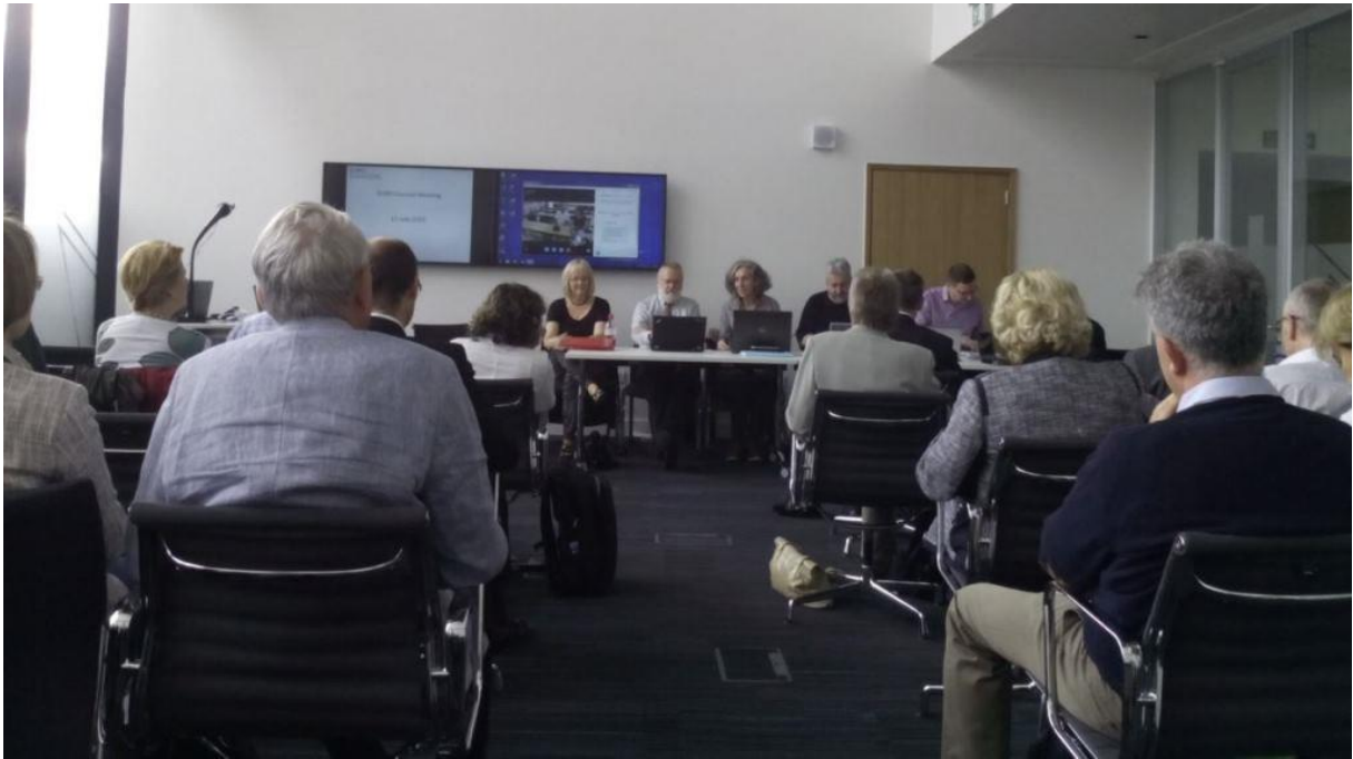
EURO Council Meeting, Sunday July 12, 2015.