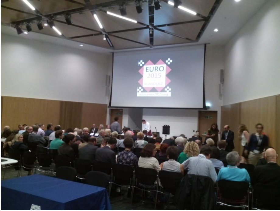
EURO 2015 Opening Session, Sunday July 12, 2015.